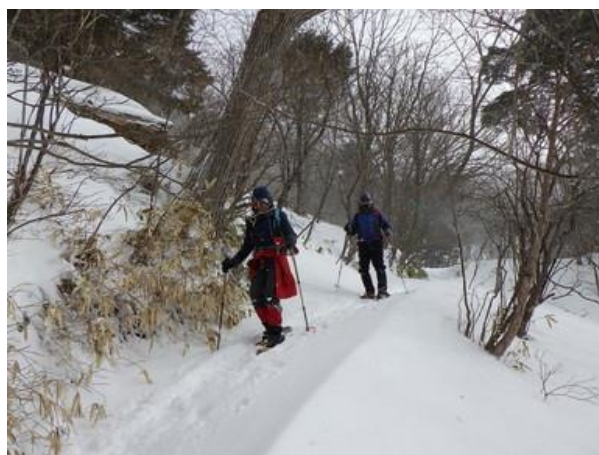
湯元温泉への下り