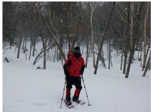
誰だかわからない