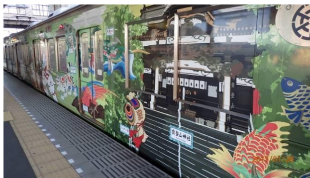
秩父鉄道のデザイン車両で行って来ました。

天気は快晴で、蠟梅は満開、梅も満開でした。昼食は事前予約の連絡を入れて待ち時間も短く出来、予定より約1時間早く帰れました。冷えた体に温かい、おっ切込うどんが美味しかったです。 (阿部ま)