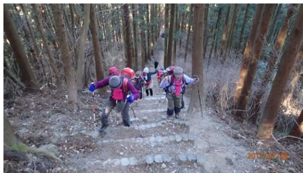
心臓破りの階段 約200段