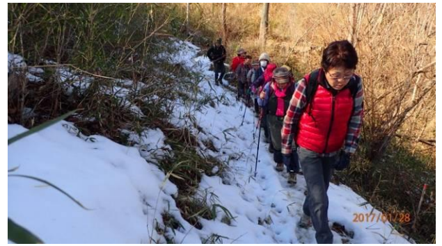
隣の駅までもう一歩き 少し雪が有りました。

先日までは、強い寒気に襲われて毎日炬燵でゴロゴロした生活を送っていて、今回の山も寒くて止めたいなと思っていました。その矢先にリーダーより、参加の確認をされ、家人の強い勧めを受けて参加をしました。参加した翌日の新聞では旧暦正月の「春慶節」で観光地の賑わいを報じていましたが、ここ秩父の地は一足早い春の兆しを感じる穏やかな陽気で、とても楽しい一日を過ごすことができました。