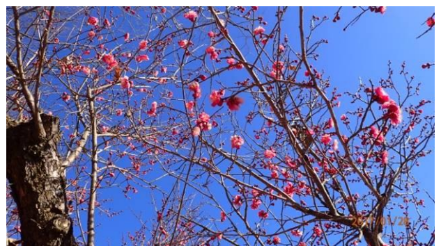
梅も咲いていました。