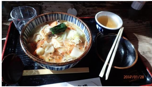
郷土料理の おっ切込うどん 寒い時は最高！