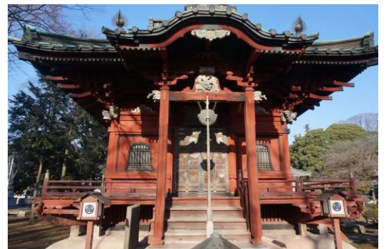
慈眼寺、将軍様のお休み所