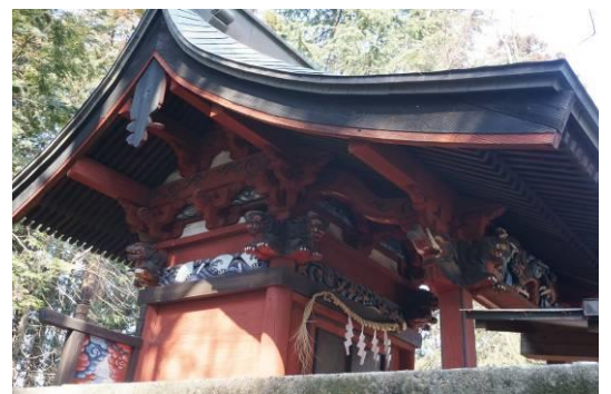
石橋の愛宕神社、彫刻がすばらしい