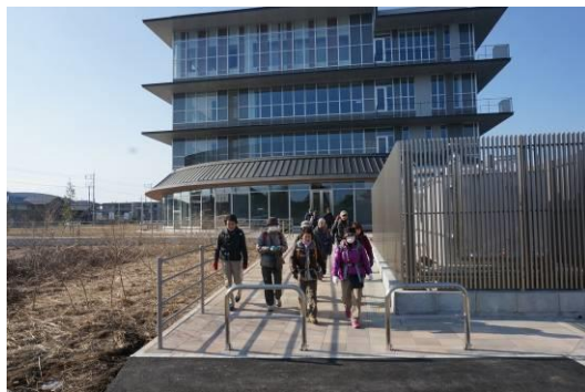
下野市の新庁舎、ロビーの中が日光街道