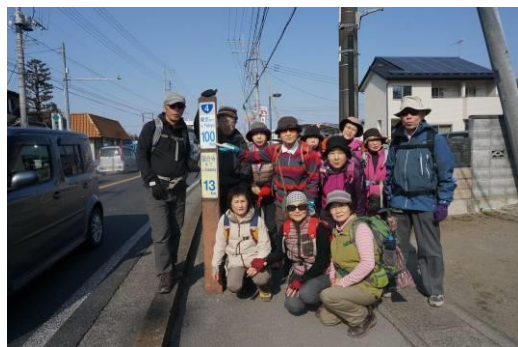
日本橋から100km歩いてきた