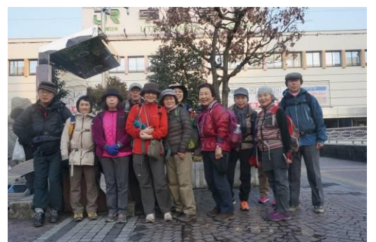
今日の到達点、宇都宮駅

「日光街道を歩く」も5回目。やっと宇都宮に到達した。みんな良く歩く！！ あと一回では、日光にたどり着けそうもない。次回は今市くらいまで、そして最終回で日光東照宮、神橋にたどり着けるだろう。