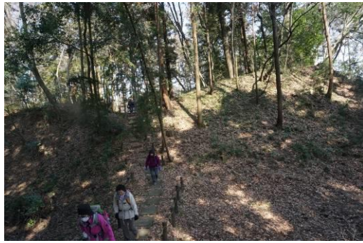
ええ！！ こんな所に鎌倉期の城跡、堀と土塁がそのまま残っている