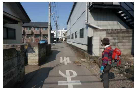
4号線の脇、こんな道も日光街道