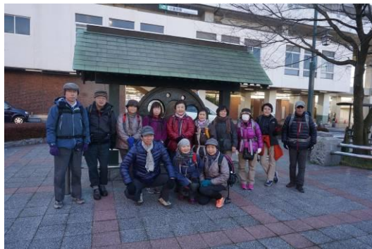
小金井駅前 出発です