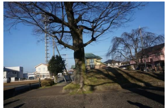
小金井の一里塚、前回の到達点