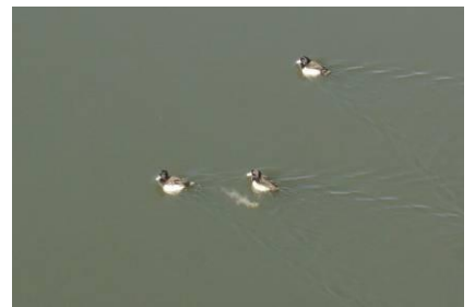
一生懸命泳いでいます