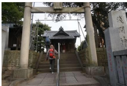
浅間神社、本殿の彫刻は凄い