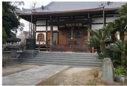
国土安穩時、忠秀、光家、葵紋