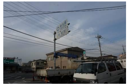
埼玉県・草加市に入った