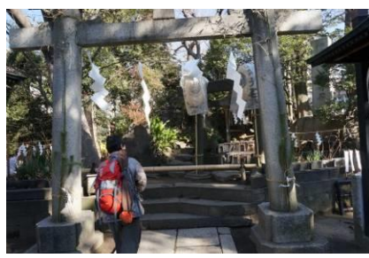
素盞雄神社のふじ塚