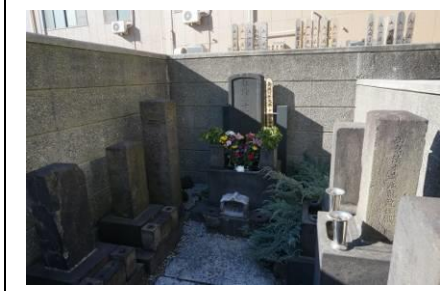
千住回向院、吉田松陰の墓