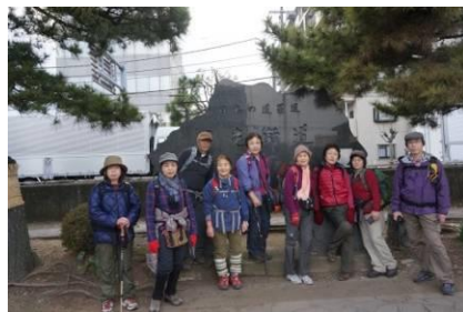
やっとここまで来た