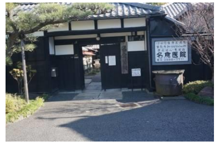
名倉医院（整形外科）